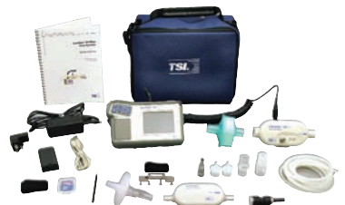
4080高流量テストシステム 4082低流量キットを含む

部品番号 内容 1208061 予備のバッテリーパックと 充電器キット 1303860 プリンターケーブル