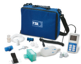
4070高流量テストシステム 4073酸素センサーキットを含む

TSI Incorporated — 500 Cardigan Road, Shoreview, MN 55126-3996 USA