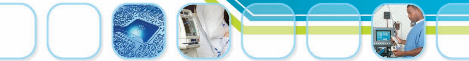
バイオメディカルテスト装置