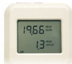
显示 2 项测试参数