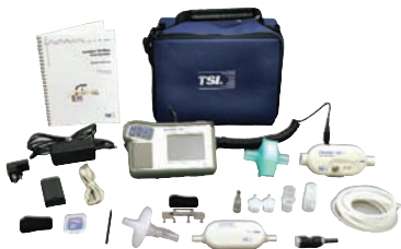
4080 高流量测试系统包括 4082 低流量套件

部件号 说明 1208061 额外的电池组和充电器套件 1303860 打印机电缆