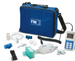
4070 高流量测试系统包括 4073 氧传感器套件

TSI Incorporated — 500 Cardigan Road, Shoreview, MN 55126-3996 USA