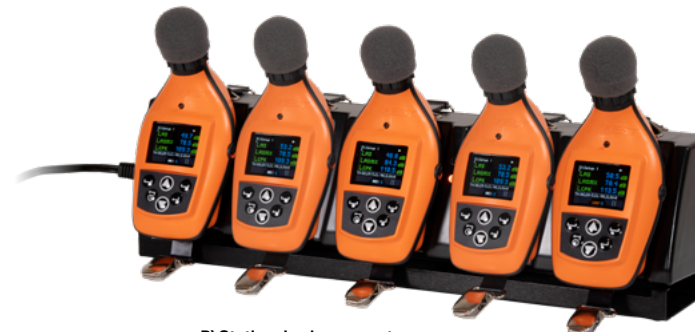
B) Station de chargement EdgeConnect