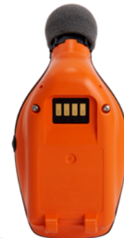
A) Face arrière du Edge