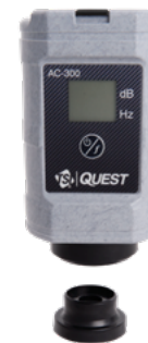
Anneau de la carte