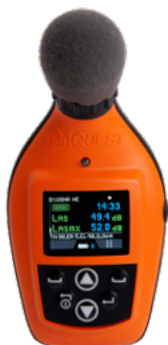
Écran de mesure