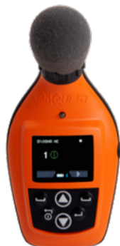
Écran compte à rebours