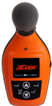
Écran de démarrage