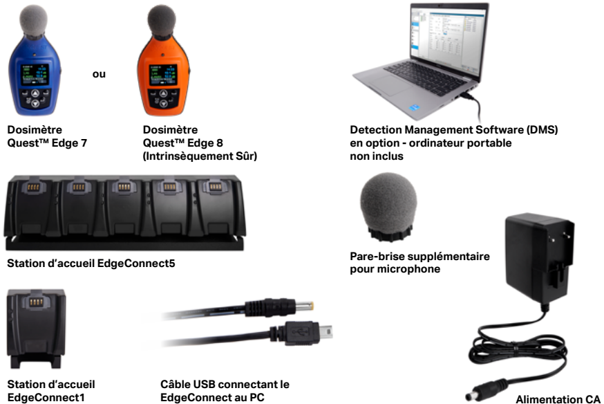
Figure 2-1: Identification de votre équipement

(Pour plus d'informations sur les pièces/accessoires, reportez-vous à tsi.com)