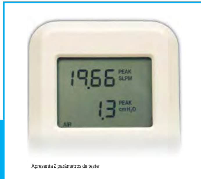
Apresenta 2 parâmetros de teste