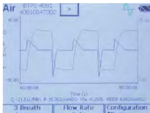
Registra gráficamente hasta 2 parámetros del test