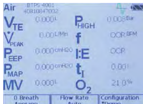
Muestra hasta 18 parámetros del test