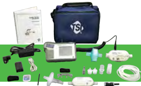
Sistema de pruebas de flujo alto 4080 con kit del sensor de oxígeno 4082 (vendido por separado)