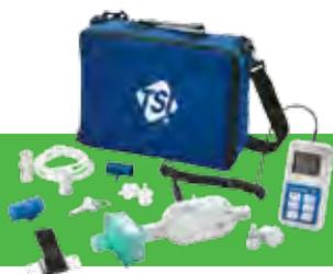
Sistema de pruebas de flujo alto 4070 con kit del sensor de oxígeno 4073 (vendido por separado)

TSI and the TSI Logo are registered trademarks of TSI Incorporated.